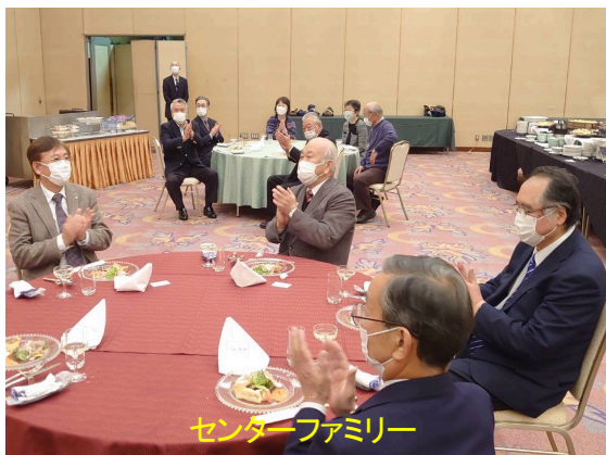
センターファミリー