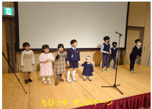
ちびっ子 オンステージ