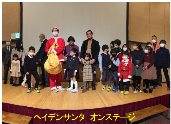
ヘイデンサンタ オンステージ