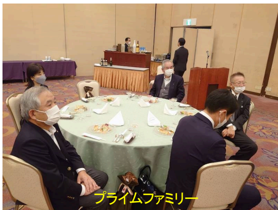
プライムファミリー