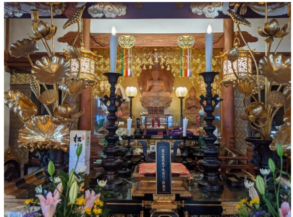
本堂。御本尊 釈迦牟尼仏