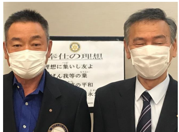
9月結婚祝い 大島会員 泉会員