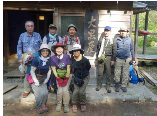
集合写真 大黒屋前にて