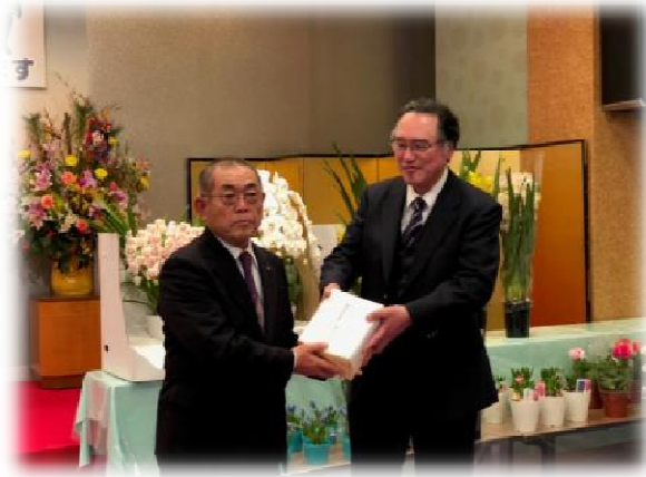
ダブル受賞の大森会員