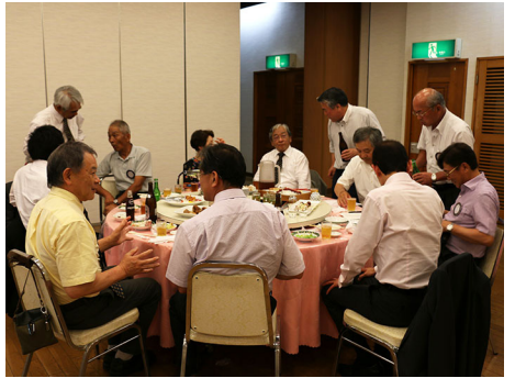
宴もたけなわ、大いに盛り上がっています。

家内に言われました。会長挨拶文作りが無くなって、ポーとして「ぼけないでね。」と。まだぼけるのには少し早いように思うので、これからも、がんばっていければと思う次第です。今後ともよろしくお願いいたします。