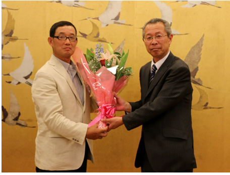
和気会長エレクトに村山会長ノミニーから花束贈呈