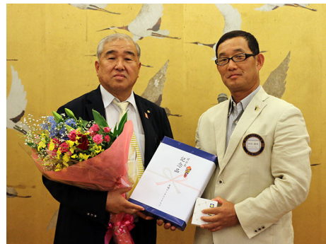
澤田会長に和気会長エレクトから花束と記念品の贈呈

開宴に先立ち会長・幹事・副会長・事務局に次年度の会長・幹事・副会長・事務局から花束が贈られた