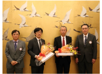
新旧会長幹事一同