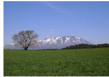
小岩井牧場の1本桜 後ろは岩手山です。