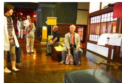
持ちきれない程のお土産でした。