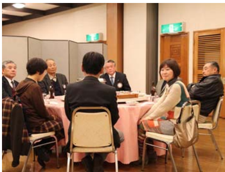
会長挨拶を静かに聞く皆さん