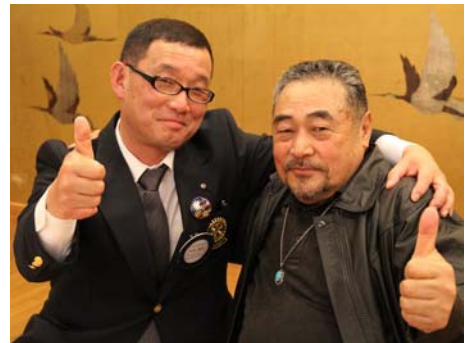
バイク仲間の強い絆