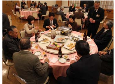
いつもながらの和やかな歓談風景