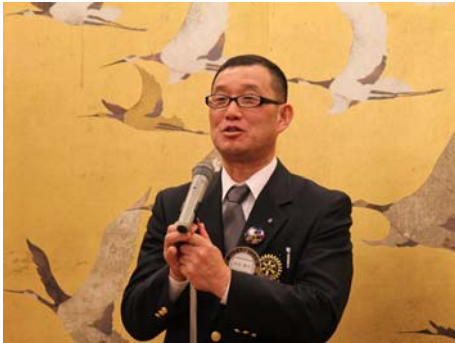
懇親会和気勝利会長挨拶